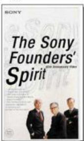
ソニー創立50周年記念ドキュメンタリービデオ