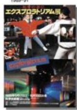
ソニーフランスに在る参加体験型科学館の日本巡回展