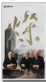
ソニー大型名誉会長の経営哲学を伝えるドキュメンタリービデオ