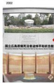
展示企画、デザイン、映像コンテンツ制作、システムインテグレーション、データ構築