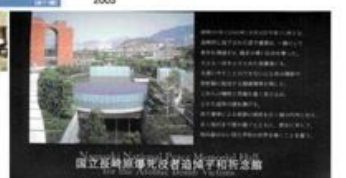
展示企画、映像コンテンツ制作、システムインテグレーション、データ構築